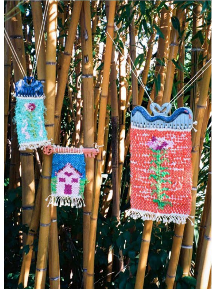
Sortie de résidence été 2022, La Magnanarié, Vaucluse.