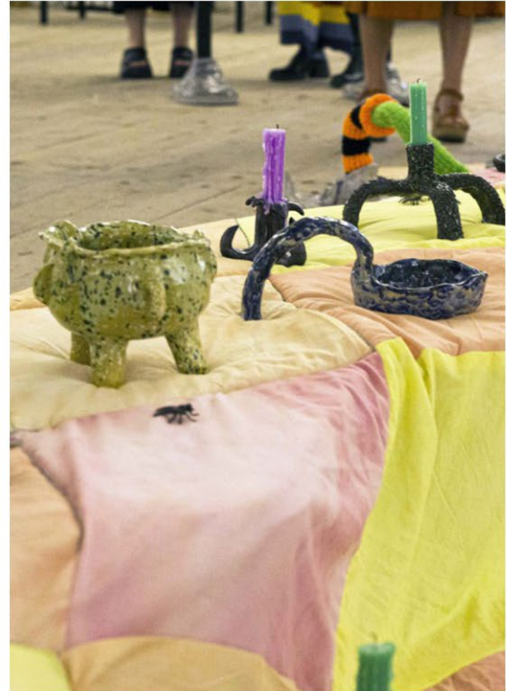
Un serpent dans la soupe 2023-24. Installation 180 céramiques, coton teint. Exposition poudrière à Mont dauphin.