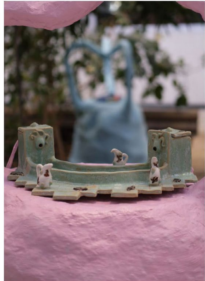
Monstera, exposition septembre 2021, Hangar Belle de Mai, Marseille.