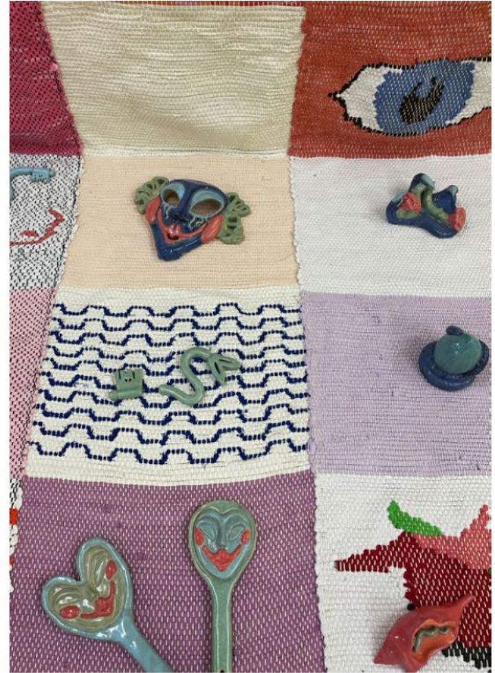
Murmuration vol.2, exposition septembre 2022, Friche Belle de Mai, Marseille.