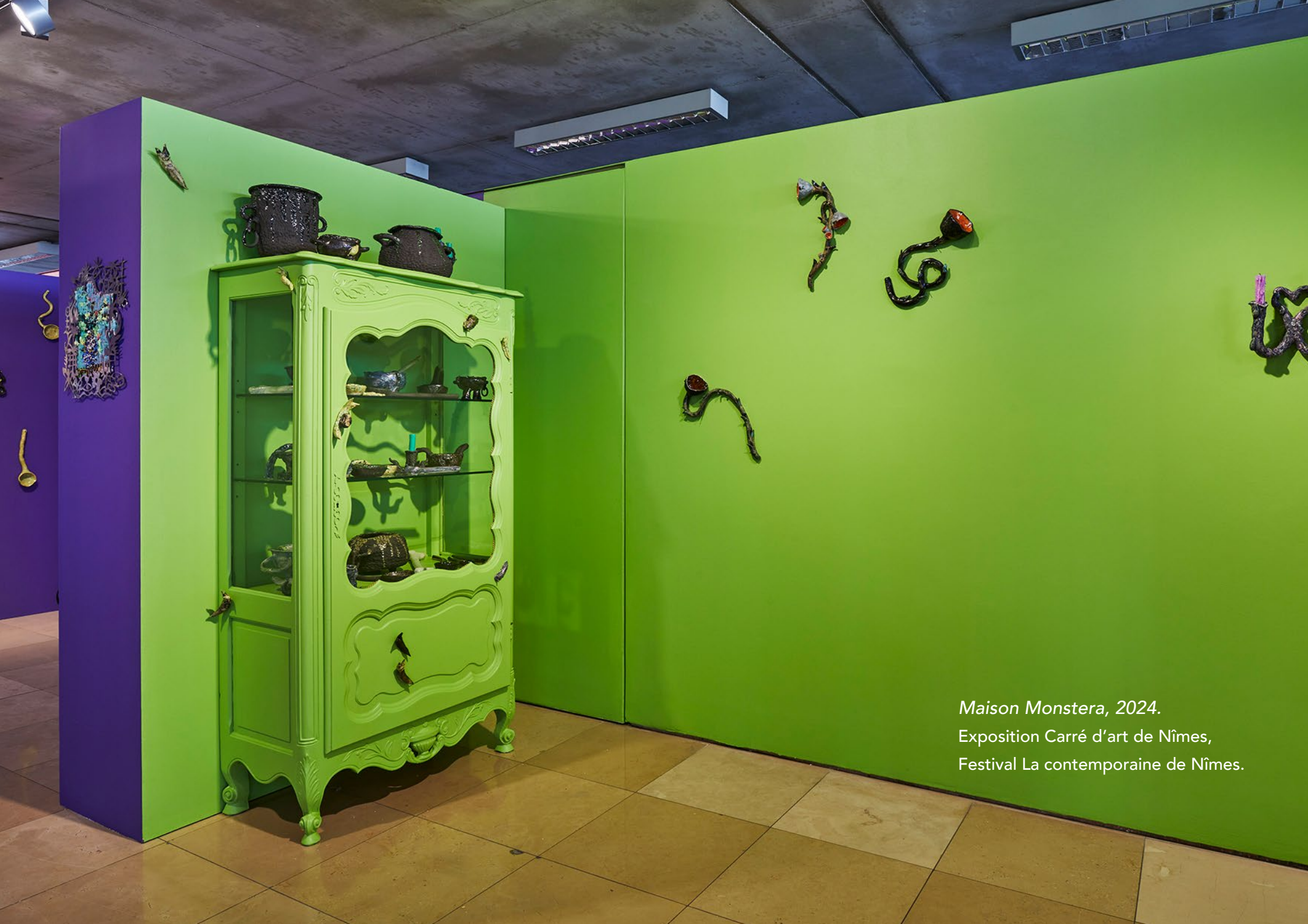
Maison Monstera, 2024. Exposition Carré d'art de Nîmes, Festival La contemporaine de Nîmes.